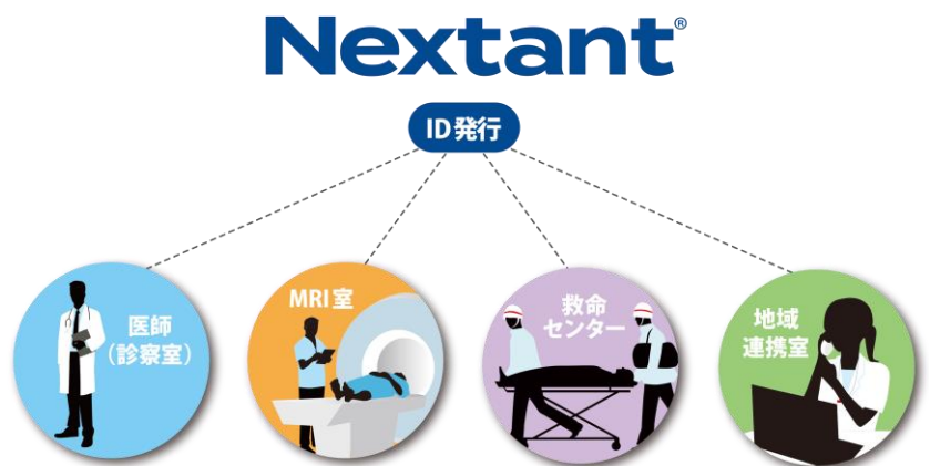
図2 ID 発行理想例

理想としては、依頼医師が患者様のインプラント情報を調べ、MRI 検査が出来ると確認をした上でオーダーを出す事と思います。この作業がとても大変ですので、MRI 室問い合わせとなっています。Nextant 導入により、この作業が大幅に楽になり医師だけではなく、特別専門知識のない医療スタッフでも簡単にインプラント情報を検索できますので、医師の働き方改革にも一役買っています。また、地域連携室にも ID 発行しておけば、開業医の先生方からの問い合わせも、MRI 室を介さずにスムーズに対応できます。（図2）